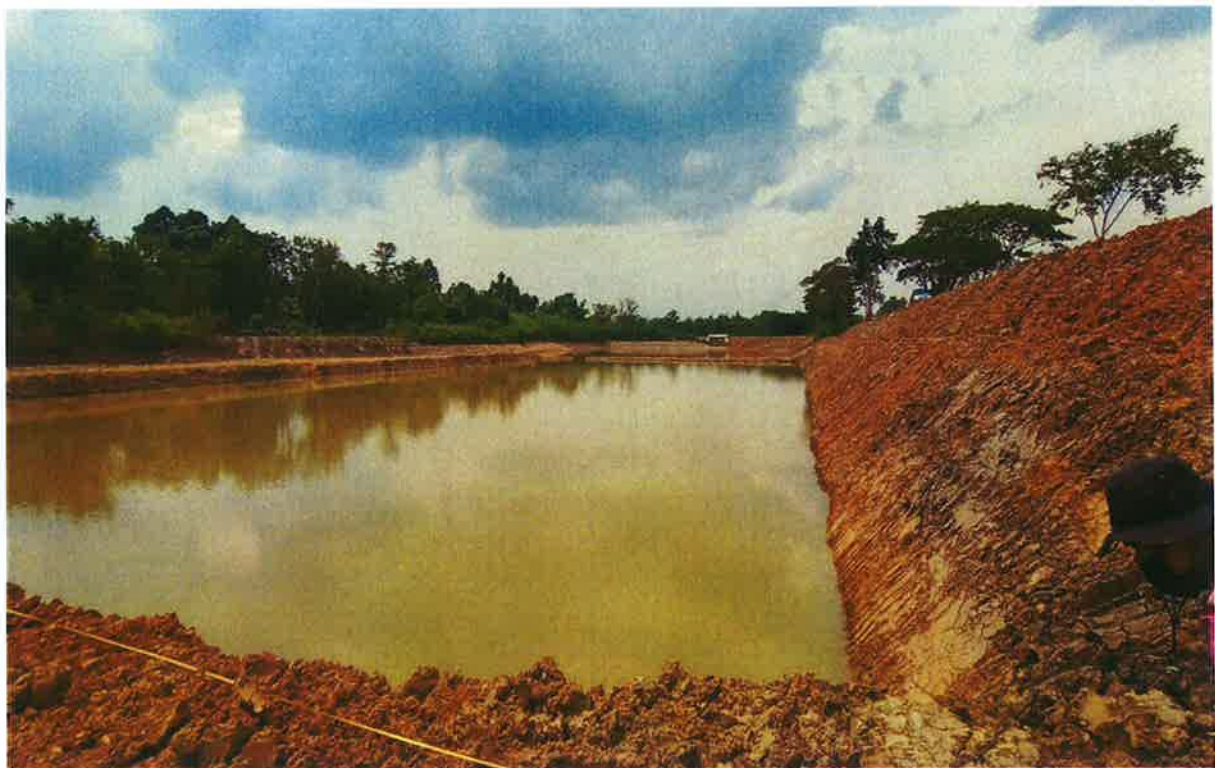
โครงการขุดลอกหนองไฮ หมู่ที่ 3 บ้านหนองไฮใหญ่