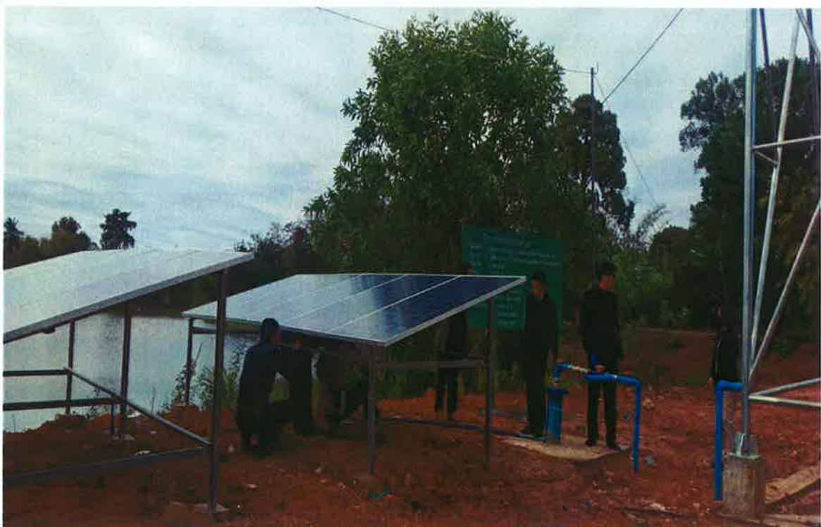
โครงการขุดเจาะบ่อบาดาล หมู่ที่ 4 บ้านหนองบัว